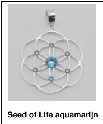
Seed of Life aquamarijn

Het is dus van groot belang dat je zowel brandpunt bent als verbonden met het geheel. Ik werk in mijn praktijk met de kosmische horoscoop en kristallen en