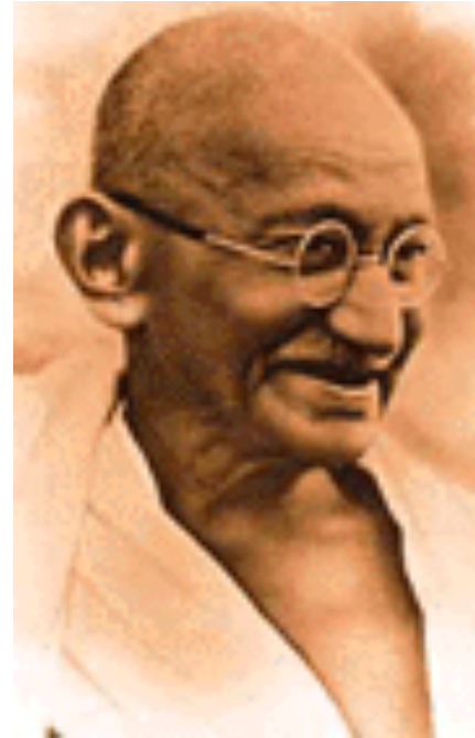
Afb: Mahatma Gandhi

In 2009 is de situatie anders dan de jaren na 2009. Na 2009 tot eind 2024 zullen machtstructuren mogelijk wel vormkracht ter beschikking hebben. In 2009 is deze vormkracht er niet of nauwelijks. Door de speciale stand van Pluto in het Zwarte Maan kanaal in 2009, wordt in dit jaar van ons gevraagd de kosmische octaaf van macht neer te zetten. Dat betekent dat ‘macht’ naar een hoger octaaf getrokken wordt. Pluto geeft het signaal af ‘ het moet ’. Op een lagere octaaf veroorzaakt dit macht en onmacht. In de hogere octaaf werkt de energie zodanig dat alles wordt gekend in wat het IS. Dan is er overgave, niets hoeft anders te zijn dan het is. De spanning valt weg en manipulatie speelt geen rol meer, want alles wordt gekend. ‘Het IS zoals het IS’ en dit brengt ons in de staat van Zijn ”. Vanuit dit Zijn , vallen wij samen met de Bron. Daarom noem ik Pluto ‘de wachter op de drempel’ voor het Zijn en het leven vanuit je kernkwaliteit verbonden met je Bron.