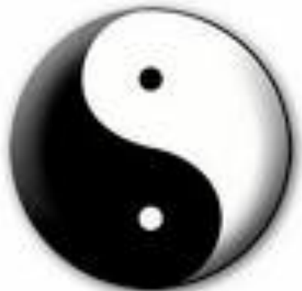
Yin en Yang teken, symbool voor het evenwicht tussen het vrouwelijke en mannelijke principe

Onze westerse maatschappij en economie is gericht op marktwerking, groei en actie, het mannelijke principe. Er is nauwelijks ruimte voor het vrouwelijke principe, rust, het ontvankelijke, innerlijke beschouwing, het intuïtieve en gevoel. De balans tussen actie en rust, inspanning en herstel, tussen geven en ontvangen, is niet tot nauwelijks aanwezig. Iedereen moet daar nu zelf actief balans in brengen, want de maatschappelijke structuur ondersteunt dit niet. En deze structuur gaat tussen 2008 en 2024 sterk veranderen, als Pluto door Steenbok loopt.