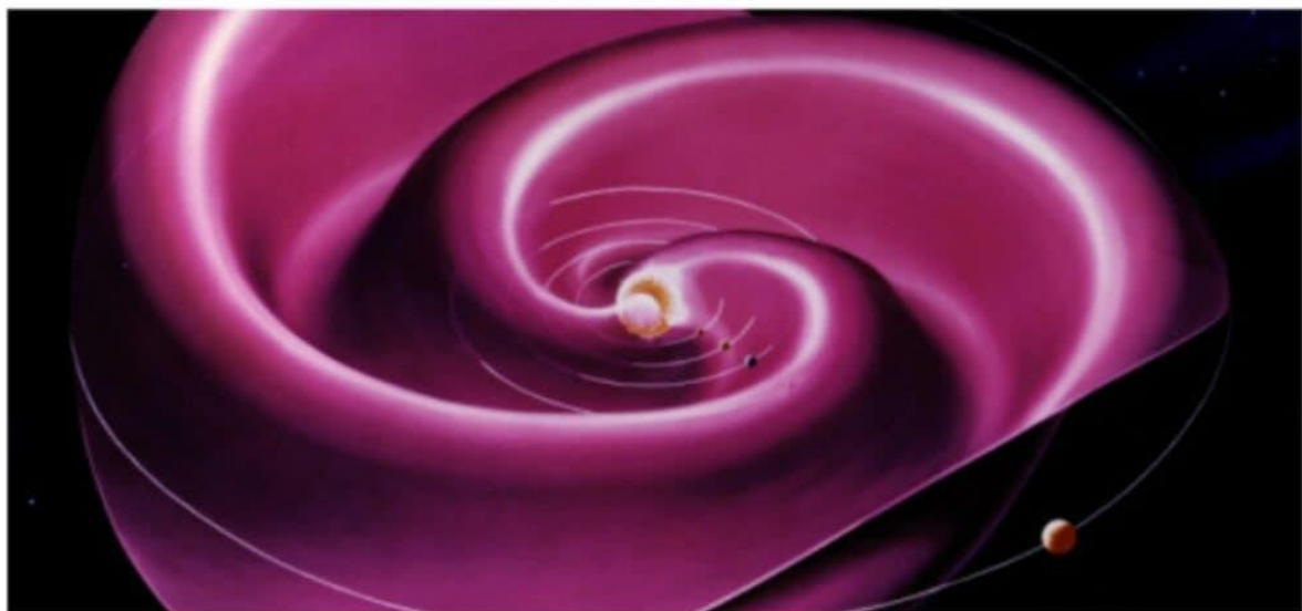
An artist's concept of the heliospheric current sheet.

https://inzichten.com/category/elektromagnetische-updates/